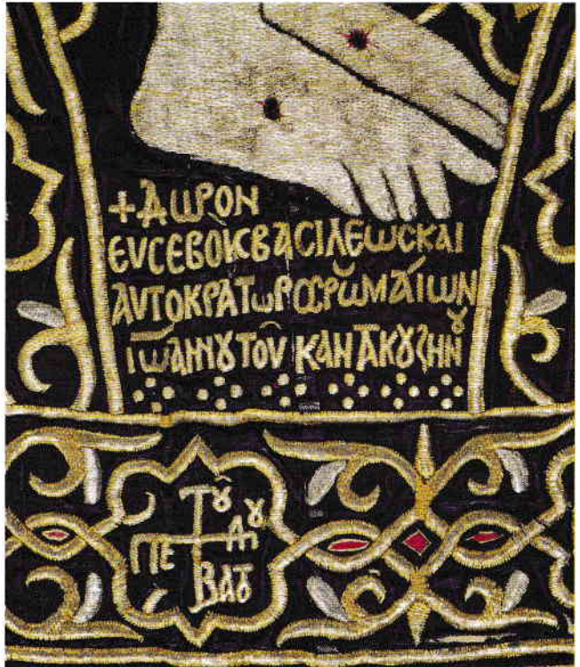
Ἡ ἀφιερωματικὴ ἐπιγραφή τοῦ Ἀυτοκράτορος Ἰωάννου ΣΤ΄ Καντακουζηνοῦ. Λεπτομέρεια ἀπὸ Ἐπιτάφιο 14ου αἰ. The dedicatory inscription of Emperor John VI Kantakouzenos. Detail from an epitaphios, 14th c.

Χρυσοκέντημένοι Ἐπιτάφιοι, ἄμφω ἐπιτραχήλια, καλύμματα ἀγίων σκευῶν καὶ ἄλλες λειτουργικὲς ὑφάσεις μαρτυροῦν τὸ ὕψος τῆς βυζαντινῆς καὶ μεταβυζαντινῆς τέχνης, ὅπου τὸ μετάξι καὶ τὸ χρυσὸ νήμα συνδυάζονται μὲ εὐλαβῆ διάθεση καὶ μὲ τὴν ἀδιάλειπτη πνευματικὴ προσφορὰ τῶν ἀνωνύμων κεντητῶν καὶ κεντητριῶν, οἱ ὅποιοι ἐργάζονταν μὲ ταπεινὸ φρόνημα καὶ πίστη, μὲ τὴν προσευχὴ τους ἀποτυπωμένη πάνω στὸ ὕφασμα, ὡς προσφορὰ εὐσεβοῦς καρδιάς πρὸς τὸν Θεὸ καὶ τὴν Ἐκκλησία.